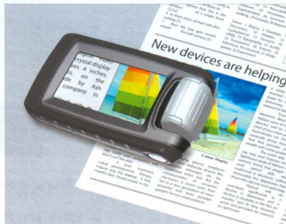
Quicklook Zoom/Ash Technologies